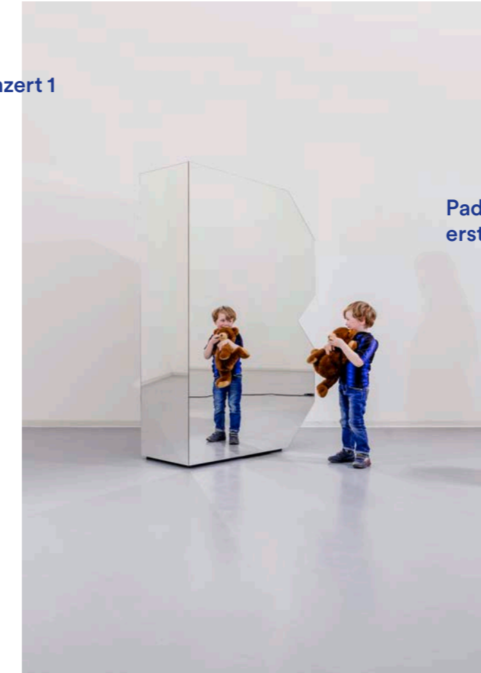
Paddington Bär's erstes Konzert